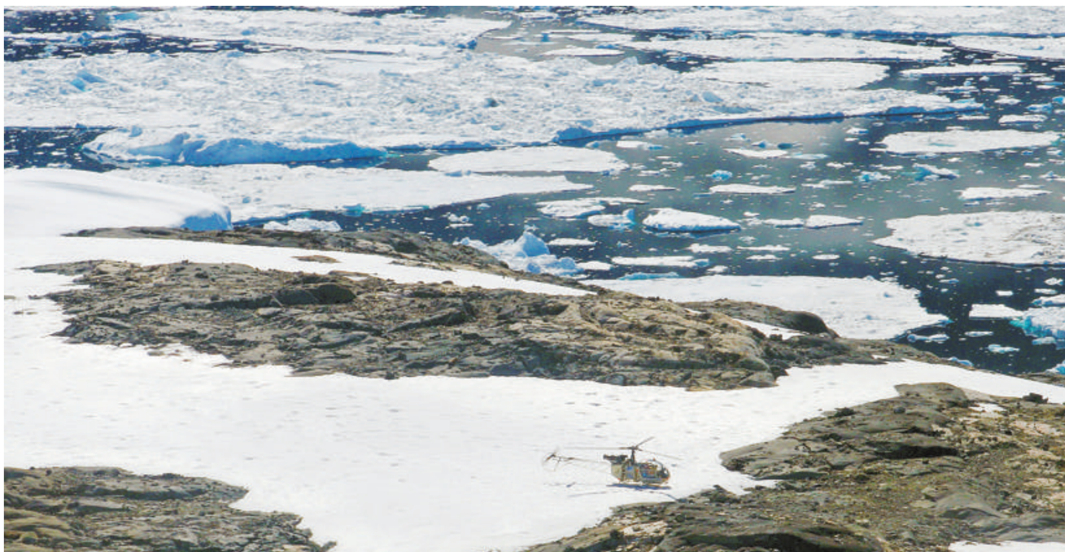
Hélicoptère cinquantenaire construit autour d'une bulle, d'une structure en tubes et d'une turbine, l'Alouette II de Pascal Petitgenêt en attente de ravitaillement sur une banquise au Groenland. Antoine Grondeau

Une escouade d'hélicoptères franchit l'Atlantique, pour fêter le centenaire de cette invention française